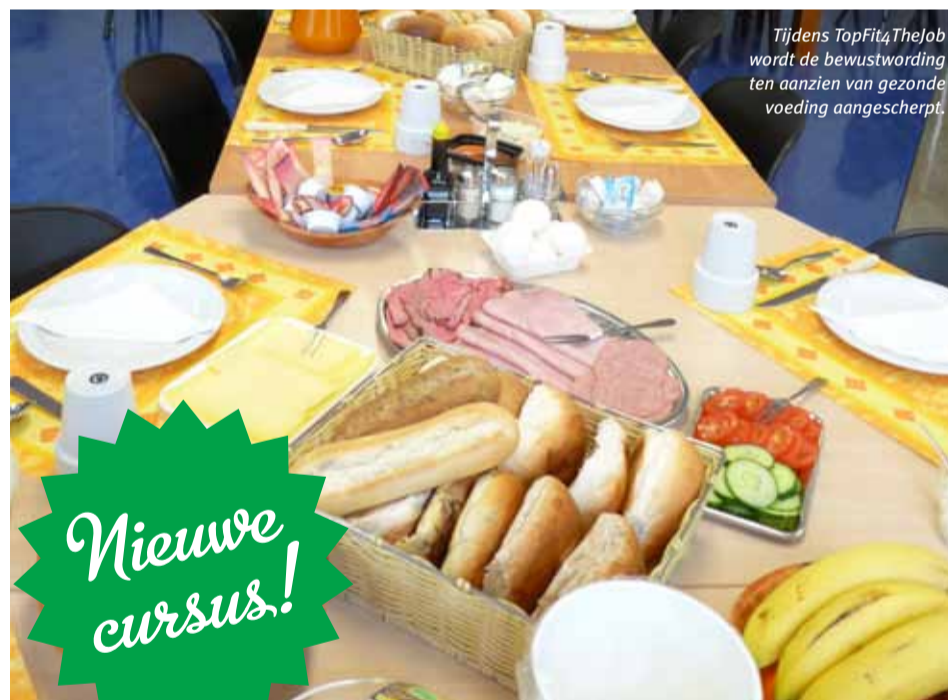
Tijdens TopFit4TheJob wordt de bewustwording ten aanzien van gezonde voeding aangescerpt.

Dakdekkers moeten, zonder allerlei lichamelijk ongemak, lang kunnen doorwerken op het platte dak. Toch is gezond oud worden in de bitumineuze bedrijfstak nog steeds geen vanzelfsprekendheid, zo tonen de verzuimcijfers aan. Dakdekken is een zwaar beroep. Daarvan zijn de gevolgen pas op latere leeftijd te zien. Zo blijken dakdekkers van 45 jaar of ouder vrij veel last te hebben van fysiek ongemak. Daarbij kan gedacht worden aan de gevolgen van het onjuist tillen, dragen, duwen, trekken of knielen. Bovendien blijken de werkhoudingen ook vrij vaak ongemakkelijk te zijn. Dit alles zorgt bijvoorbeeld voor aandoeningen aan de rug, knieën, schouders of armen, met langdurig ziekteverzuim en mogelijke arbeidsongeschiktheid tot gevolg. De fysieke belasting bij het werken op daken is zo ernstig, dat de Inspectie SZW (voorheen Arbeidsinspectie) er dit jaar een speerpunt van heeft gemaakt.