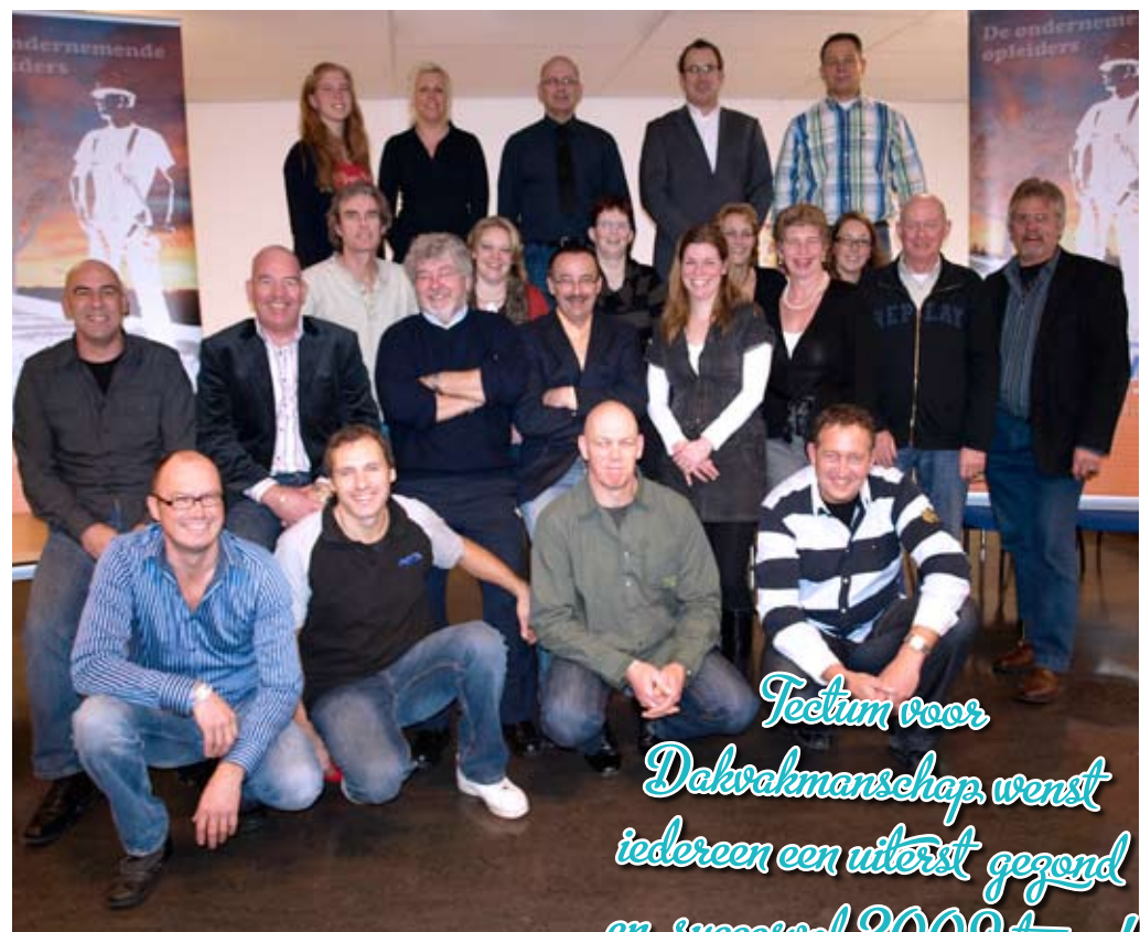
Tectum voor Dakvakmanschap werst iedereen een uiterst gezond en succesvol 2009 toe...!